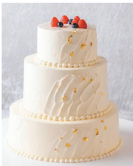
Étoile d'or エトワールドール(金の星) お一人様 1,200円