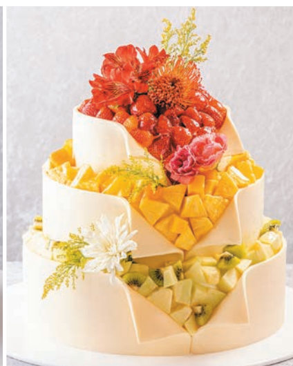
Bijoux de fruits ビジュドゥ フリュイ(フルーツの宝石) お一人様 2,300円