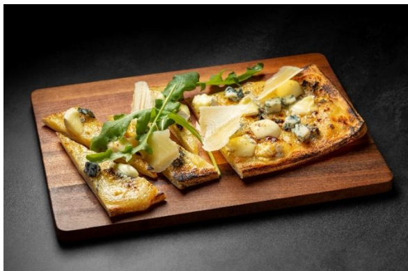
Five cheese luxury pizza 5種チーズのラグジュアリーピザ