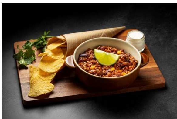
Aichi beef chili con carne 愛知県産ビーフ チリコンカン