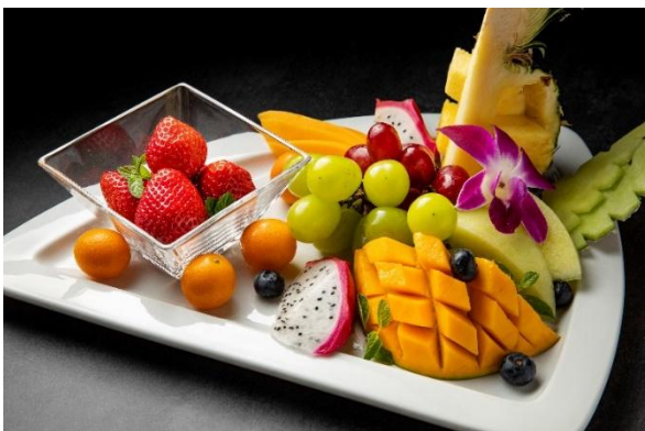
Assorted sliced fresh fruits (7 kinds) フレッシュフルーツの盛り合わせ