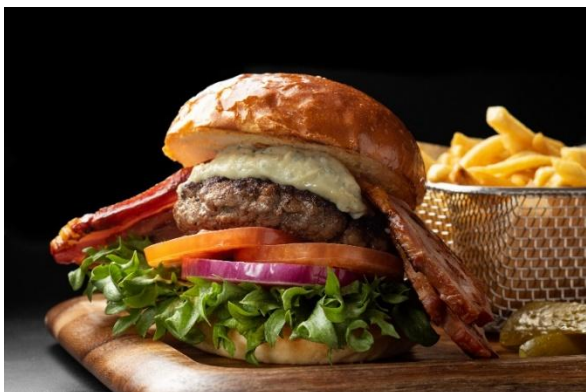
Blue cheese thick bacon burger ブルーチーズベーコンバーガー