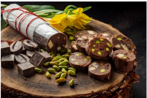
Homemade salami chocolate (7 pieces) ホームメイドチョコレートサラミ