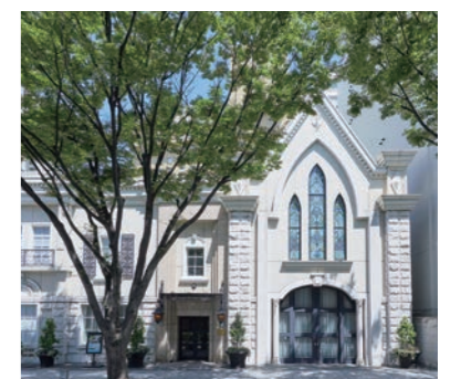
広小路通から望む英国調コロニアル 建築のホテル外観