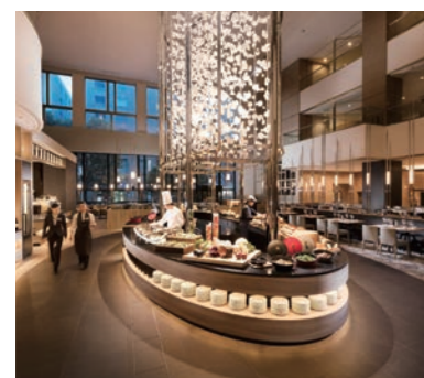
ロビー階に位置する開放的な オールデイダイニング「インプレイス3-3」

世界展開を続けるヒルトン・ホテルズ&リゾーツのホテルの一つとして1989年に名古屋市内初の外資系ホテルとして誕生。「ヒルトンスタンダード」といわれる高水準のサービスを誇るファーストクラスのホテル。